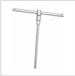
SERVİS TE BORU DELME ANAHTARI