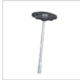
SERVİS TE BORU SIKMA ANAHTARI