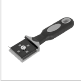
EL TİPİ BORU KAZIYICI